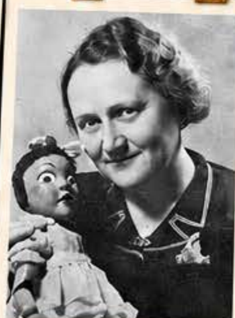
Božena Weleková (1910–1989)